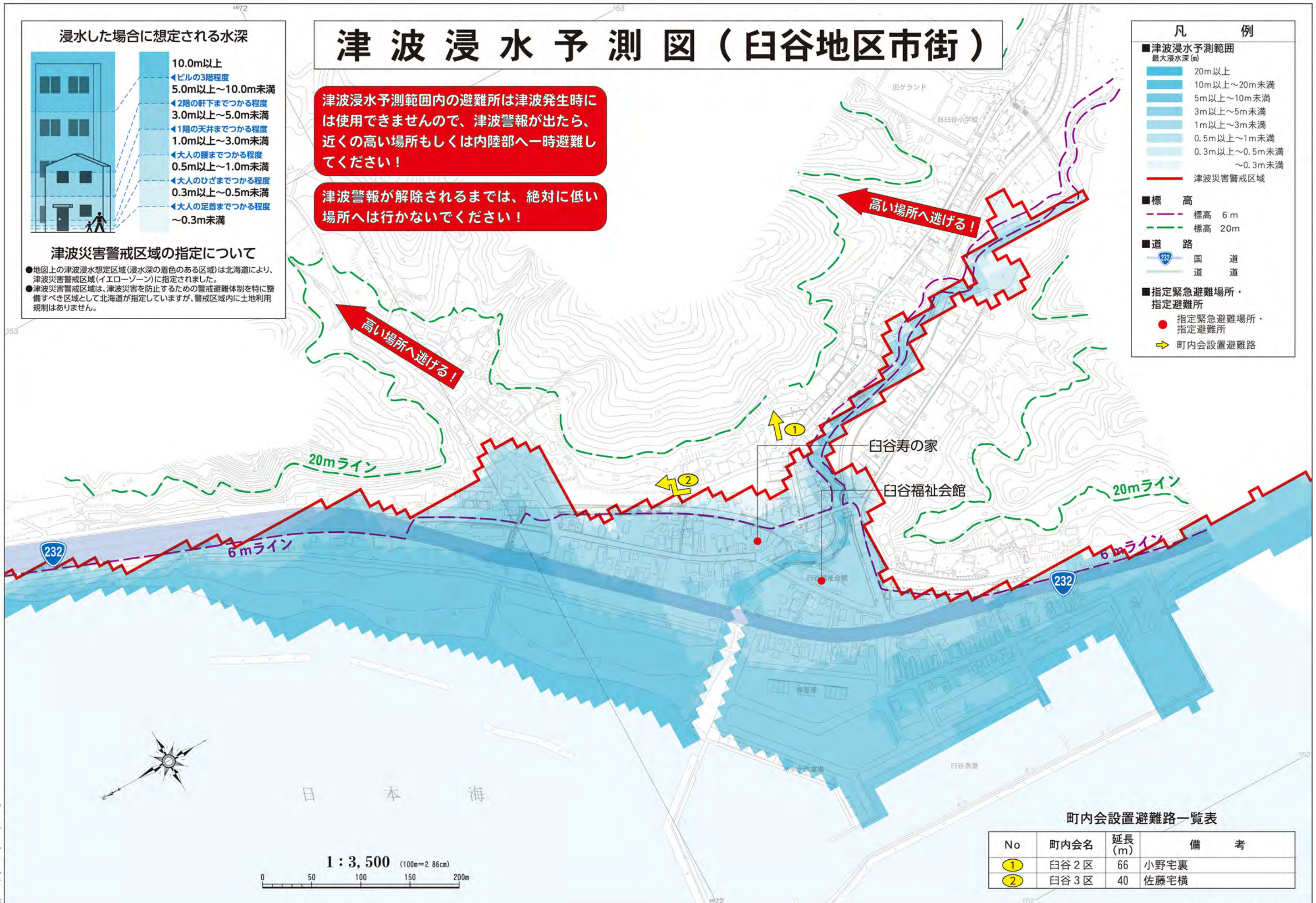
町内会設置避難路一覧表