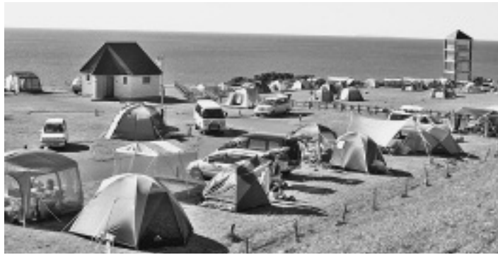
直営管理となった 望洋台キャンプ場

■白谷橋外橋梁長寿命化計画の策定について(住吉中央橋、沖内「万福橋」) 住吉中央橋については、来年度から長寿命化修繕事業が予定され、工事期間も長期にわたるとのことであるが、工事実施の際には、施工の内容や工期、工事期間の通行の方法、時間帯等について検討し、地域住民の十分な理解を得たうえで周知徹底を図り、施工にあたらねたい。 なお、今後、長寿命化修繕事業を計画的に進める際にも同様の措置を講じるよう努められたい。