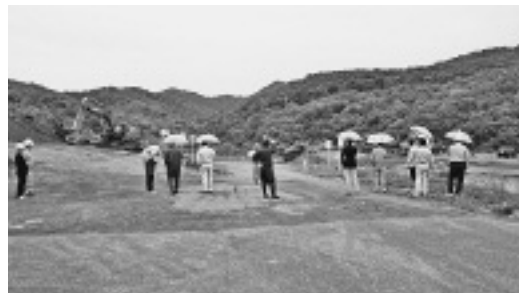
生ごみ中間処理施設造成工事

■生ごみ中間処理施設建設工事の進捗状況について 工事の進捗状況については概ね理解を得た。今後の施設開設に向け、万全を期すよう要望する。