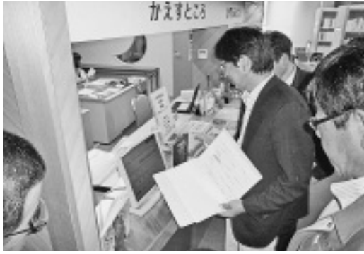
文化センター図書室 図書検索システム

■文化交流センター図書室 電算化システム導入業務及び 利用状況について 電算化タッチパネルディスプレイ 検索により、図書の貸し出し状況の確認が容易となり、利用者の拡大が期待される。 今後、システムの有効な活用として端末器を鬼鹿・達布支所及び各学校にも配置し、ネット回線により使用が可能になるよう計画的な整備を検討されたい。