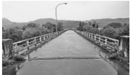
長寿命化修繕工事が予定されている 住吉中央橋

■白谷橋外橋梁長寿命化計画の策定について(住吉中央橋、沖内「万福橋」) 住吉中央橋については、来年度から長寿命化修繕事業が予定され、工事期間も長期にわたるとのことであるが、工事実施の際には、施工の内容や工期、工事期間の通行の方法、時間帯等について検討し、地域住民の十分な理解を得たうえで周知徹底を図り、施工にあたらねたい。 なお、今後、長寿命化修繕事業を計画的に進める際にも同様の措置を講じるよう努められたい。