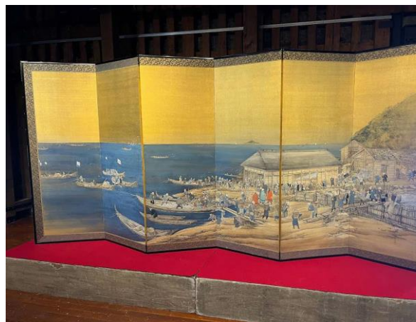
小樽市有形文化財「海岸ノ漁場屏風（鯨盛業屏風）」（講師写す）