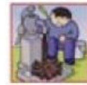
沢や井戸の水が濁る。

次のような現象を察知した場合は、土砂災害が直後に起こる可能性があります。直ちに周りの人と安全な場所へ避難するとともに、関係機関へ通報して下さい。