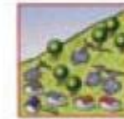
斜面から水がふき出す。