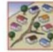
地面にひび割れができる。