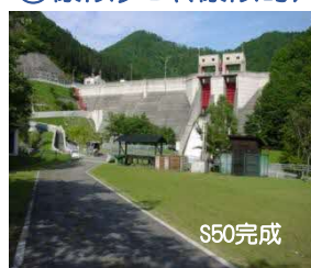
さまに ④様似ダム(様似町)