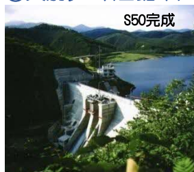
やべつ ②矢別ダム(函館市)