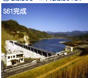
あいべつ ⑥愛別ダム(愛別町)