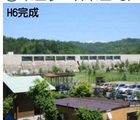
くろやま ①栗山ダム(栗山町)