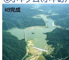
おびら ⑧小平ダム(小平町)