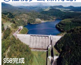
さほろ ⑨佐幌ダム(新得町)