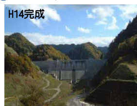
かみのくに ③上ノ国ダム(上ノ国町)