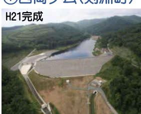
にしおか ⑦西岡ダム(剣淵町)