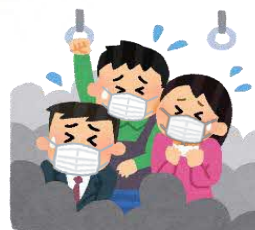
混雑した乗り物の中