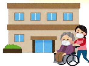
高齢者施設など に行くとき