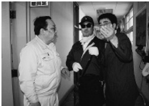
不審者の学校侵入を想定して行われた 鬼鹿小学校避難訓練