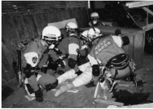
生き埋めになっていた生徒に見立てた ダミー人形を救出する参加者

留萌警察署と留萌消防組合消防署 小平支署合同の救出・救助訓練が、 解体が進められている旧本郷中学校 校舎を利用して行われ、留萌署と消 防小平支署から計30人が参加しまし た。