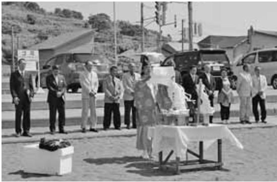
シーズン中の安全を祈願した海開き (臼谷海水浴場)

7月11日に臼谷海水浴場とおいしかツインビーチが海開きとなりました。 両海水浴場で行われた安全祈願祭には、観光協会役員のほか、町や地区の関係者が参列し、シーズン中の無事故と好天を願い、参列者一人ひとりが神前に玉ぐしを捧げました。 海開き当日には、両海水浴場に家族連れの海水浴客が訪れ、遊泳やビーチボールでの遊びを楽しんでいました。