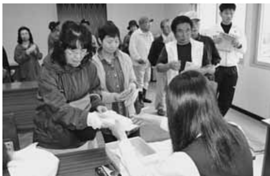
プレミアム商品券を買い求めに多くの住民が訪れた小平町商工会会場