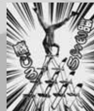
東京都小平市在住 【魂の肉体表現者 ジロー今村】