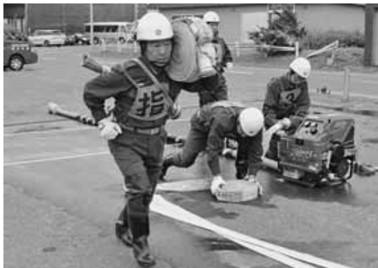
勇ましい姿を披露した小型ポンプ操作