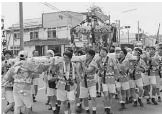
小平市街を練り歩く御輿

町商工会青年部が、小平・鬼鹿神社の清掃を実施しました。 この活動は、6月10日の「商工会の日」に合わせて展開されている商工会青年部全国統一事業「絆・感謝運動」に町の商工会青年部が賛同し、昨年の鬼鹿中学校窓清掃に引き続き実施されました。 清掃には9名の青年部員が参加し、箒やタオルを手に、例大祭を控えた神社の中や外を丁寧に清掃していました。