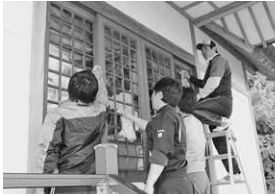
神社の清掃する商工会青年部員（小平神社）