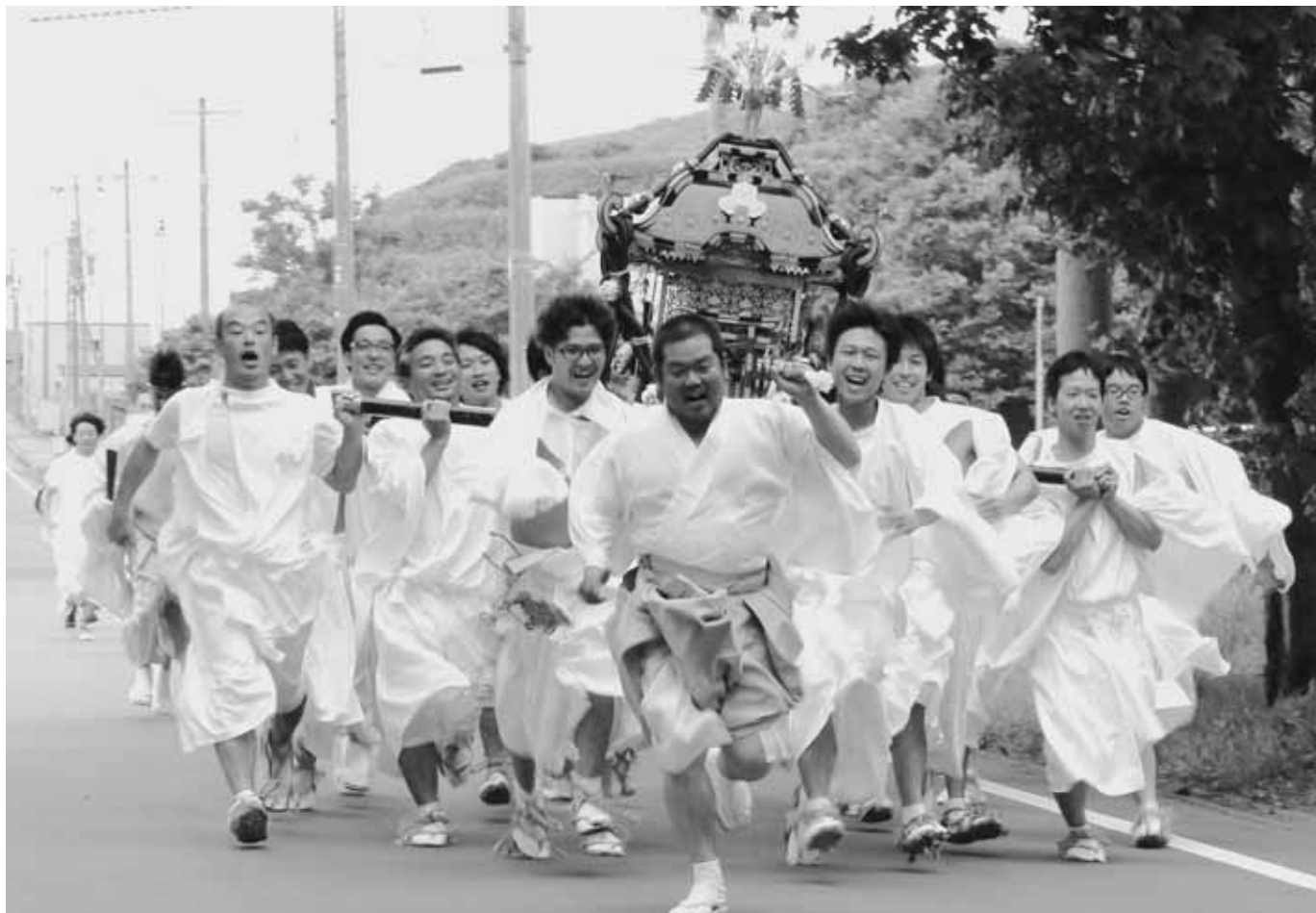
鬼鹿殿島神社例大祭「御輿渡御」