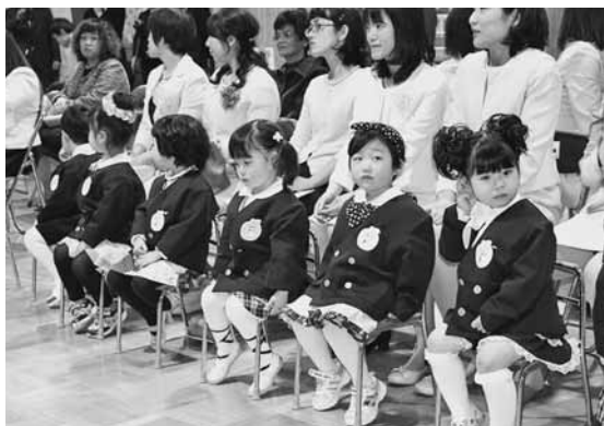
緊張した様子の園児たち

また、8日には小平幼稚園、鬼鹿幼稚園で入園式が行われ、新入園児たちが保護者に手を引かれながら、少し緊張した面持ちながらも、名前を呼ばれると元氣いっぱい返事をし、晴れの姿をお父さんやお母さんに見せていました。