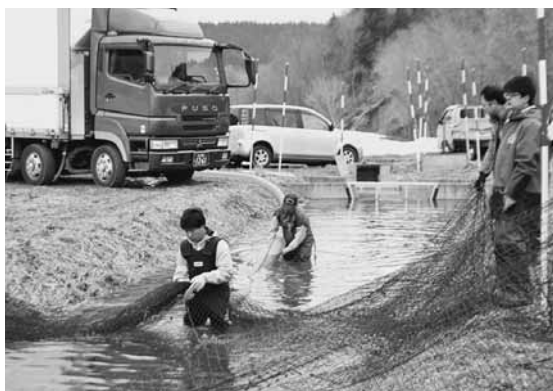
施設に放たれるサケの稚魚

サケ稚魚放流作業が幌沖内川上流で行われ、新星マリン漁業協同組合、道立水産ふ化場関係者が、サケの稚魚約200万匹を4月13日から2日間にわけて稚魚中間育成施設や、町内の川へ放流しました。 稚魚は、道立水産ふ化場道北支場から輸送され、帰率を高めるために、中間育成施設では約2週間飼育された後、川に放流されます。 放流されたサケは、約4年後に2%程の帰率で遡上するとされています。