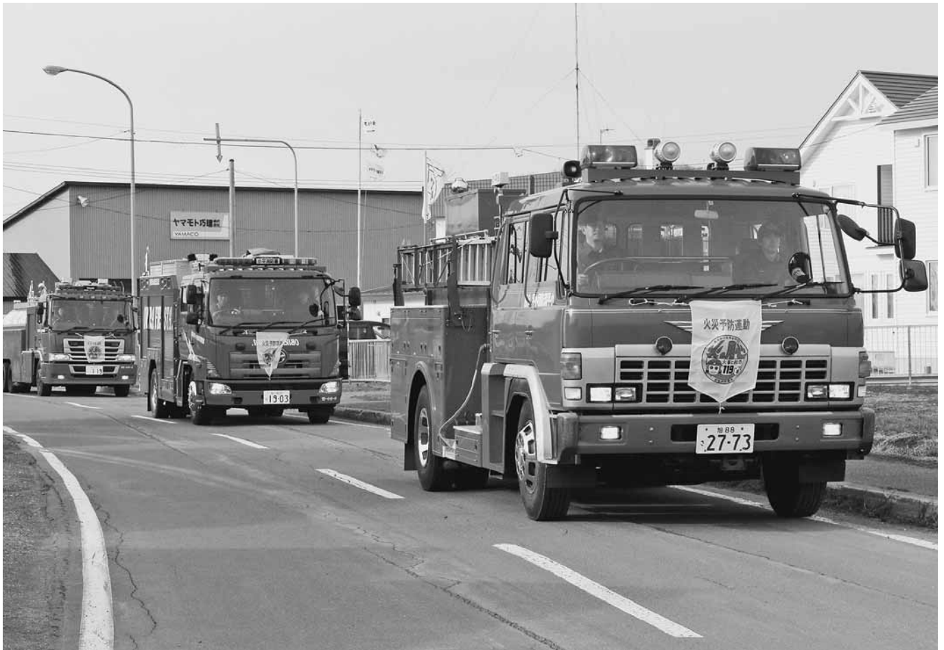
春の火災予防運動防火パレード