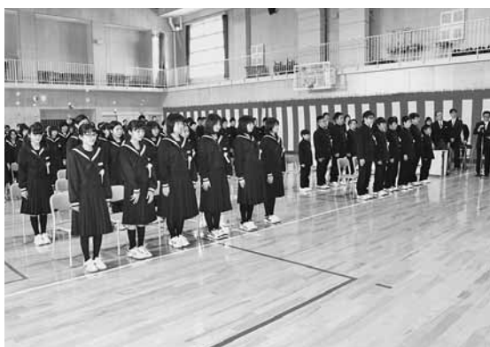
27名が入学した小平中学校