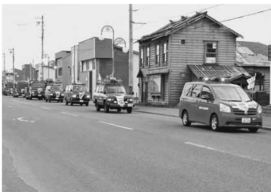
防火パレードを皮切りに始まる春の火災予防運動

留萌消防組合小平消防署・鬼鹿支署と小平消防団（小平・達布・鬼鹿分団）による防火パレードが町内一斉に行われました。小平地区では7台、達布地区では4台、鬼鹿地区では4台の消防車両が各地域をパレードし、火の用心を呼びかけました。防火パレードは、空気が乾燥し、火災が発生しやすいこの時期に行われる「春の火災予防運動」初日に実施されています。30日までの運動期間中には、高齢者単身世帯への防火訪問活動や、火災防ぎょ訓練等が行われます。