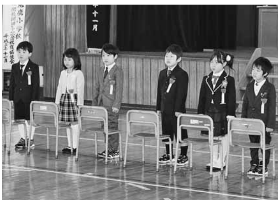
元氣にあいさつをする新1年生(鬼鹿小学校)