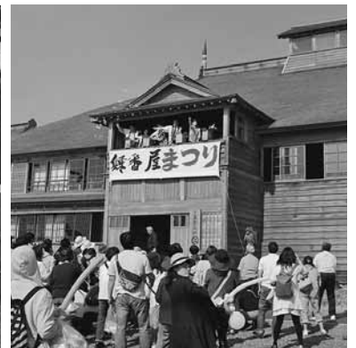
まつりのラストを飾った餅まき