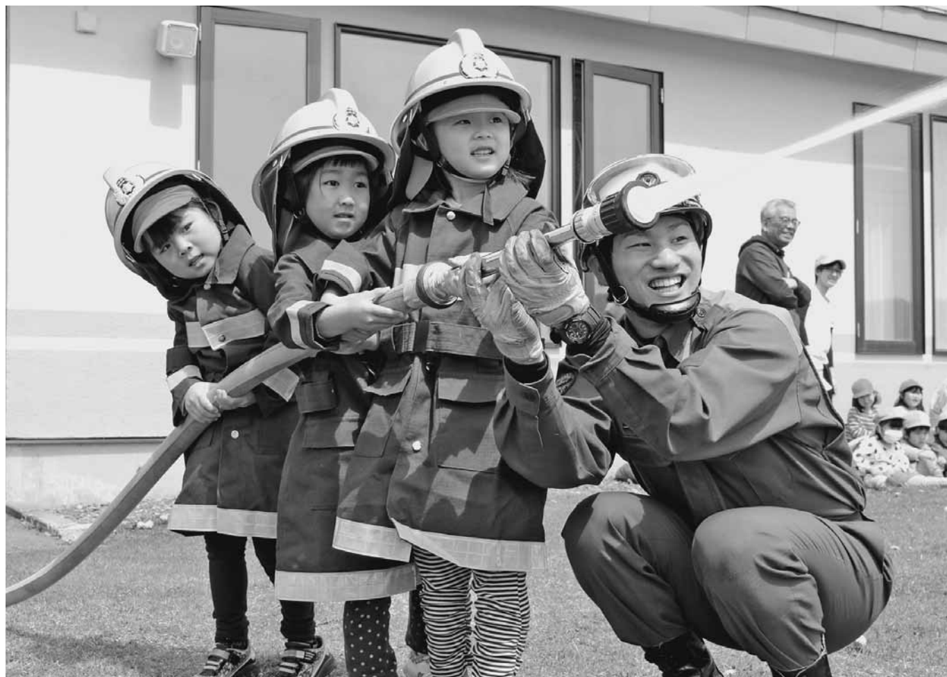
小平幼稚園春季避難訓練 放水体験