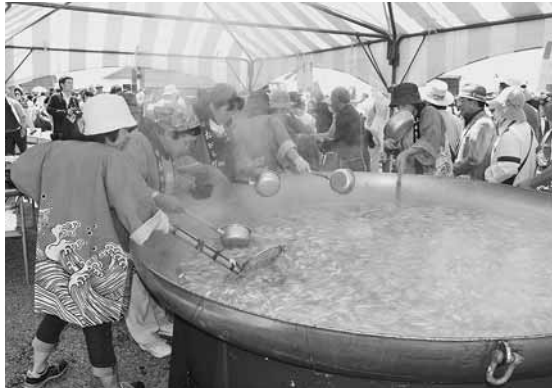
500食限定で無料配布されたニシンの三平汁

第34回鯉番屋まつりが旧花田家番屋で開かれ、来場した約3千500人が初夏の祭典を満喫しました。まつりでは、おびら太鼓麓龍や小平中学校吹奏楽部の演奏、鬼鹿松前神楽保存会の演舞、アメ細工、大漁宝引き大会や大抽選会等の催し物が行われました。グルメコーナーでは、町制施行50周年を記念して、ニシンの三平汁とホタテご飯が500食無料配布されたほか、タコやホタテ焼き等の小平の味覚が販売され、来場者は浜の味覚を堪能していました。