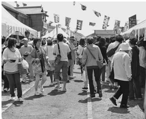
大勢の来場者でにぎわった会場