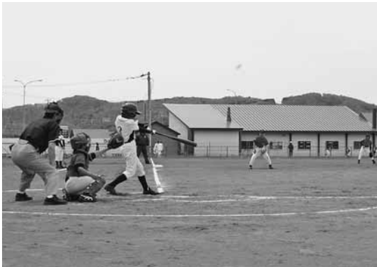
白熱した試合が行われた春季少年野球大会

春季少年野球大会が海洋センターグラウンドで開催され、4チーム約60人の少年球児が熱戦を繰り広げました。 大会には町内のチームの他、町外からも3チームが参加して行われ、各選手は優勝を目指して白球を追いかけました。 接戦の結果、小平ファイターズは勝利を逃したものの、最後まで白熱したプレーで観客を沸かせていました。