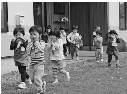
慌てずに避難をする小平幼稚園児

避難完了後には、消防職員から火災の恐さや避難の仕方を学び、避難時は「おさない・かけない・しゃべらない」を守ることを約束しました。また、放水体験もあわせて行われ、ちびっ子消防士に変身した園児らが勇敢な姿を見せていました。避難訓練では、訓練が行われることを園児に知らせず、本番さながらの中で実施されましたが、園児たちはハンカチで口や鼻を押さえながら速やかに園庭に避難することができました。5月9日に小平幼稚園、17日に鬼鹿幼稚園で春季避難訓練が実施されました。