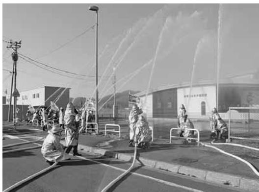
小平幼稚園を対象に行われた小平分団の訓練

4月20日から30日まで、全道一斉に春の火災予防運動が展開され、様々な火災予防啓発活動が実施されました。初日の防火パレードを皮切りに、運動期間中には少年消防クラブや婦人防火クラブ、消防団員、消防署員が一人暮らしの高齢者宅への訪問等の各種火災予防啓発活動を行い、地域住民への火災予防を呼びかけました。また、24日には小平地区、29日には達布地区、30日には鬼鹿地区で消防団各分団と消防署員による火災防ぎょ訓練が本番さながらに実施されました。