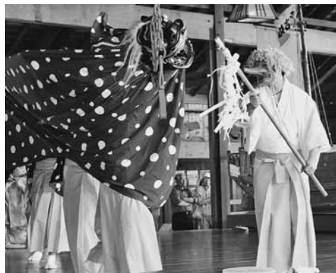
伝統的な松前神楽の演舞