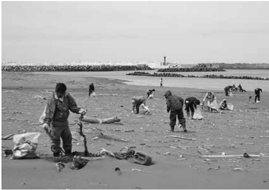
多くのゴミを集めた春のクリーンアップ日本海

春のクリーン作戦とクリーンアップ日本海が15日実施されました。当日は、各町内会や各関係団体で沿道や住宅周辺のゴミの回収、廃品回収を行なったほか、鬼鹿・白谷地区では、それぞれの地区住民が海岸に漂着したゴミの回収を実施しました。 また、12日には小平町建設業協会により、町内3か所の海岸清掃が行われ、同協会に所属する3社の従業員らが日本海のクリーンアップに汗を流しました。