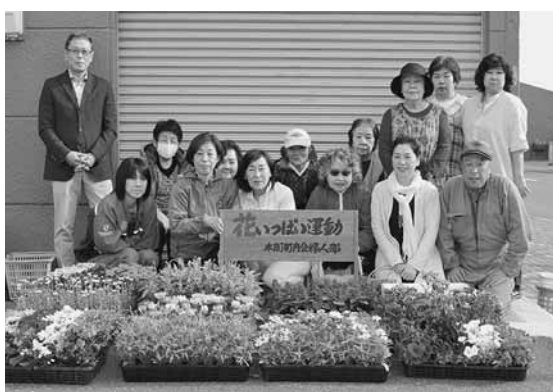
色とりどりの花が集まった「花いっぱい運動」

小平本町町内会婦人部による、花いっぱい運動が行われました。 この運動に使用された花は、同町内会と、同町内会に所属する細川花店の提供により集められました。 会場には、マリーゴールドやサルビア等の12種類・約500株の彩り豊かな花が並び、この日集まった同町内会会員たちは好みの花を選んで持ち帰りました。 持ち帰られた花は、各家庭やバス停を鮮やかに飾り付けていました。