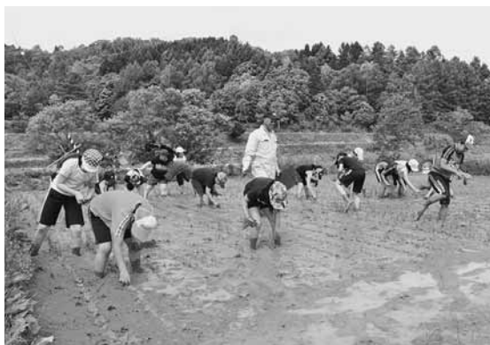
小平小学校田植え体験

町内の各小中学校にて、小平町で生産する一次産物の体験授業が行われました。 体験授業は、小平小学校では「田植え体験」、鬼鹿小学校では「ホワイトコーン種植え」、小平中学校では「メロン苗植え」が行われました。 授業では農家の方々の指導の下、生徒たちは熱心に作業を行っていました。 今回の授業で栽培している農作物は、今後学校給食などで使用される予定となっています。