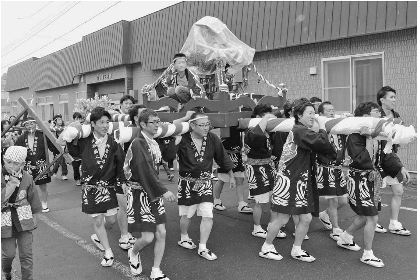
臼谷神社祭「神輿渡御」