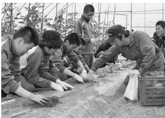
小平中学校メロン苗植え体験