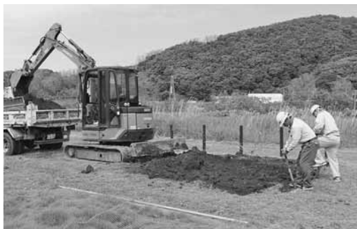
株式会社 向井建設 様 (向井勝広代表取締役) 小平幼稚園における滑り台撤去・砂場造成を実施