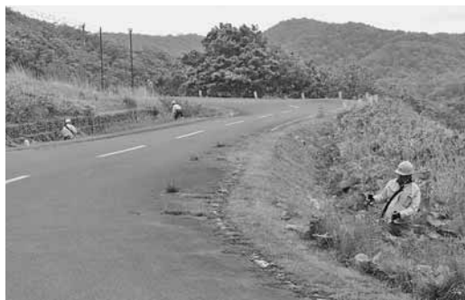
株式会社 和秀 様 (居原田隆夫代表取締役) 町道展望台線の草刈り作業を実施