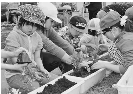
一株ずつ丁寧に植える児童たち(小平小学校)

町主催の人権の花運動が、町内の各小・中学校で行われました。 同運動は、花を育てることで、命の大切さや相手への思いやり等の「基本的人権の尊重」の精神を養うことを目的としています。 児童たちは、花の苗を受け取ると、一人ひとりの専用のプランターにサルビアやペチュニア等の色とりどりの花を一株ずつ丁寧に移植替え、「元気に育つてね」と声を掛け、花を育てる優しい心を育んでいました。