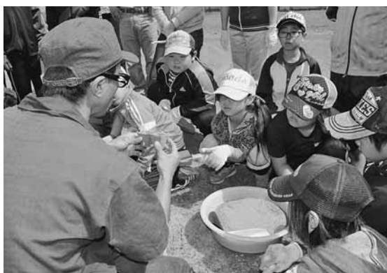
鬼鹿小学校ホワイトコーン種植え体験