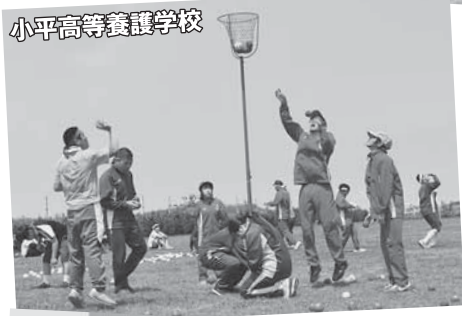
小平高等養護学校