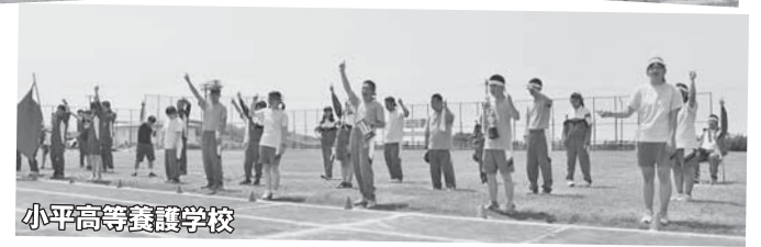
小平高等養護学校