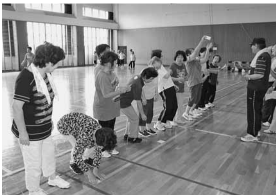
競技を楽しむ参加者

町体育協会小平支部主催の小平・本郷・臼谷地区町民運動会が海洋センターで開催され、老若男女約120名が参加しました。 この運動会は、小平地区の町内会、本郷地区町内会、臼谷地区町内会の会員が紅白に分かれて参加し、「名人パークゴルフ」や「紅白玉入れ」等の軽スポーツが行われたほか、ビッグ大会等のレクも実施されました。 参加者は、さわやかな汗を流しながら親睦を深めました。