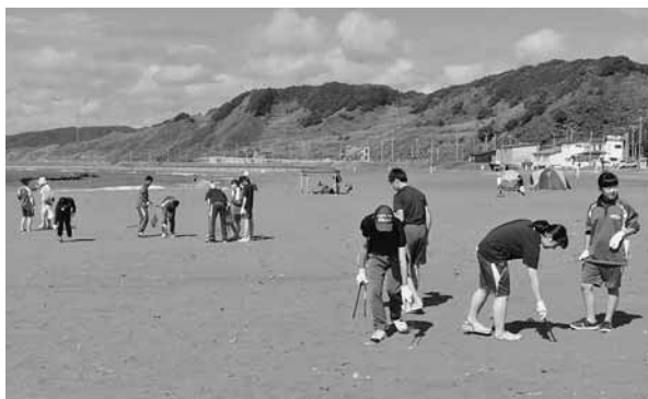
海岸の清掃を行う小平中学校の生徒 (臼谷海水浴場)