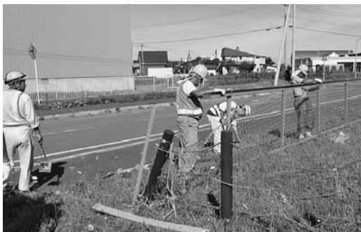
堀口・ヤマモト巧建経常建設共同企業体 様 小平幼稚園柵交換補修作業を実施