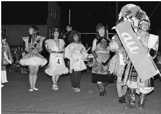
審査員にアピールする一般仮装盆踊り出場者

小平町盆踊り実行委員会主催の納涼盆踊り大会が8月17日～19日の3日間、町交通公園で行われました。最終日の19日には、毎年恒例の子供仮装盆踊りや賞金が当たる一般仮装盆踊りが行われ、子供仮装盆踊りでは、かわいらしい浴衣姿を始め、様々なキャラクターに変身して見物客を楽しませました。 引き続き行われた一般仮装盆踊りでは、団体4組、個人10名がアイアンマンや天狗などのキャラクターに仮装し、会場を沸かせました。