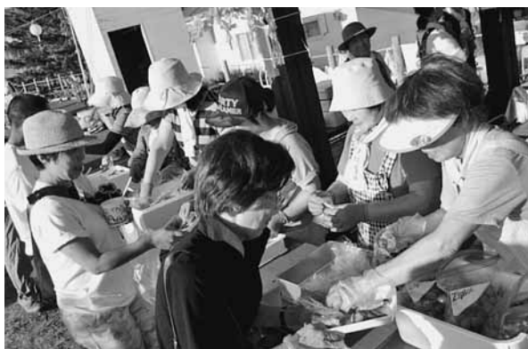
にぎわったあつ祭り