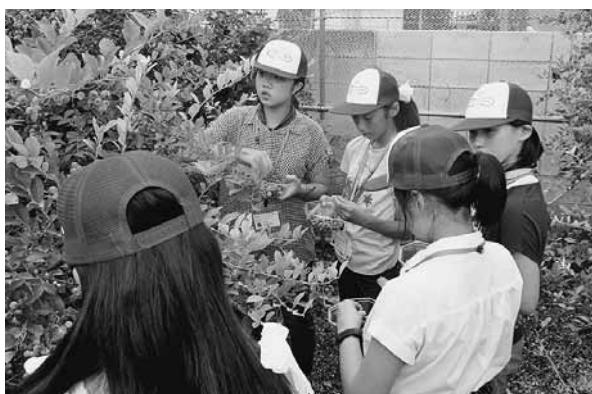
ブルーベリー収穫体験を行う両市町の子どもたち

今年も27名が参加し、臼谷、鬼鹿にそれぞれ分かれて作業を行い、海岸へ打ち揚げられたゴミを回収しました。