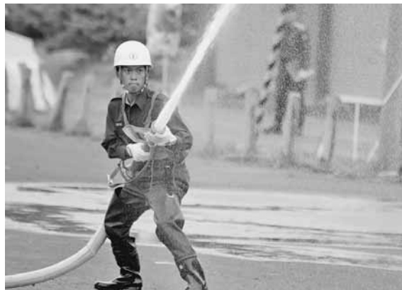
迫力ある放水訓練に挑む団員

俊敏な動作で訓練の成果を披露する団員らに、来賓からはたくさん拍手が送られました。