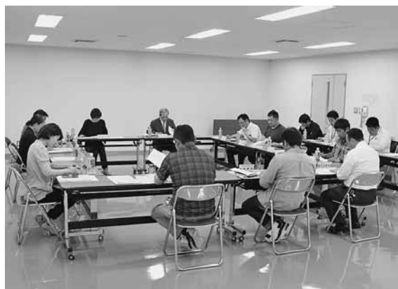
活発な意見が出された委員会

意見交換において委員からは、農泊事業についてや、都市再生整備計画フォロアップ報告書についての意見が上がりました。今後、町は会議での意見を精査しながら施策を進める予定です。