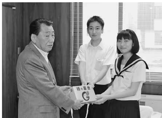
集めた募金を手渡す小平中学校の生徒

緑の募金は、学校等の身近な地域の緑化、地球の緑を増やすための砂漠化地域の緑化や熱帯林の保全等、様々な緑のために活用されます。