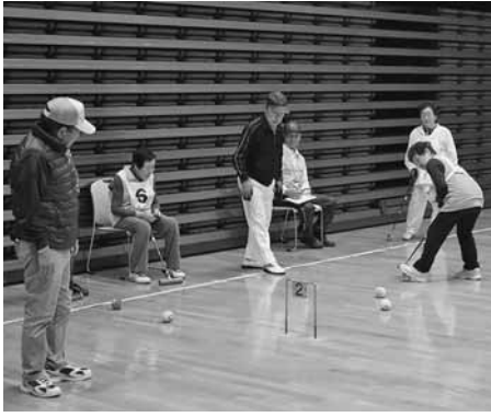
巧みな戦略を見せたゲートボール大会

また、町民スポーツレクリエーションも併せて開催され、参加した町民はノルディックウォーキングやJACOTなどに取り組み、体を動かす楽しさを学んでいました。