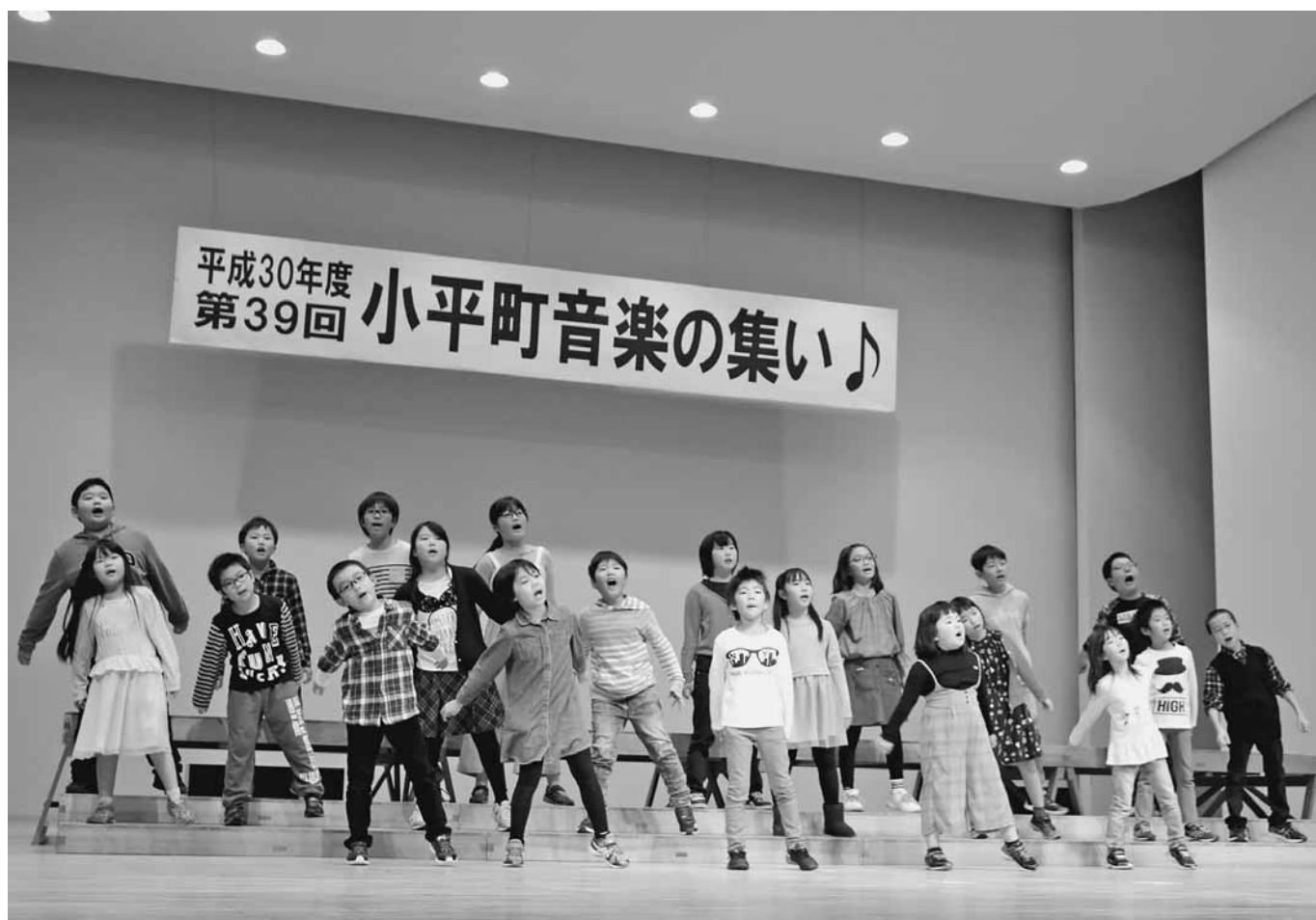
第39回小平町音楽の集い