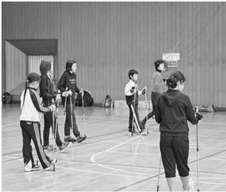
正しい姿勢や体の動かし方を学んだ町民スポーツレクリエーション