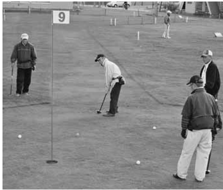
カップを狙い真剣にプレーされたパークゴルフ大会