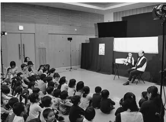
幼児たちを引き付けた腹話術

10月4日に文化交流センターで、町内の幼児向けに幼児舞台鑑賞事業として人形劇団を招き、人形劇が披露されました。