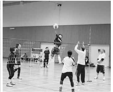
熱戦を繰り広げたミニバレーボール大会