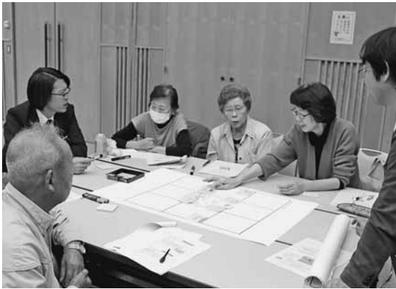
今後の学びについて意見を出し合う参加者

おびらふるさと塾が開催されるまでの道のりや、これまでの学習を振り返り、受講者が学びたいこと・取り組みたい活動などをグループで話し合いました。文化財や化石をテーマに外部からの講師を招いた講演が多い中、地元の人から学べることで、さらに町のことを学ぶため、様々な意見が飛び交いました。