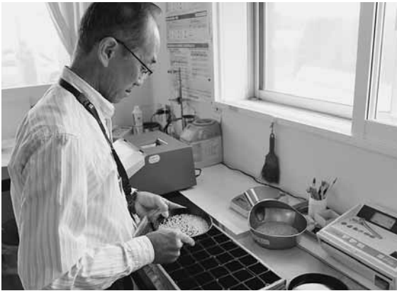
米の数値測定をする検査員