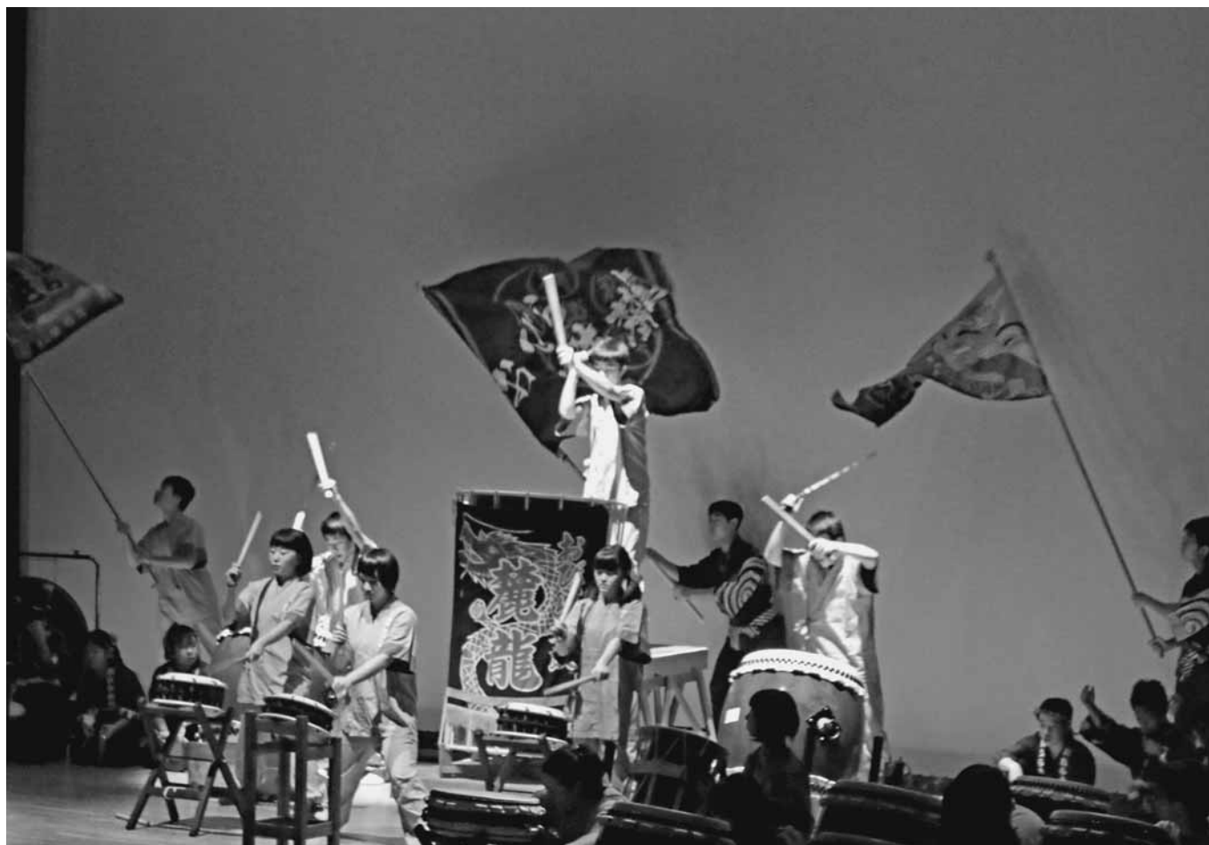
第47回小平町民文化祭 おびら太鼓麓龍&ジュニア