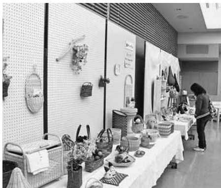
町内の各サークル・児童生徒が製作した作品が数多く展示され、多くの人の目を引き付けた作品展示会

また、13日までの間、小ホールやロビーでは力作揃いの作品が展示され、訪れた人たちの目を引き付けていました。