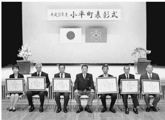
この度表彰された受章者の皆さん

また、町内に30年以上在住し、9月1日現在で85歳になられた方43名に感謝状が贈られました。