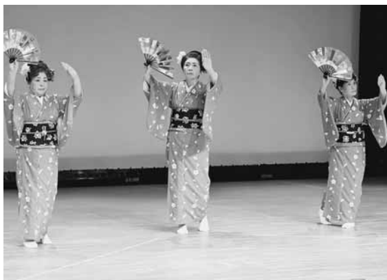
各サークルともに日々の練習の成果を披露しました

この賞は12年以上、民生委員として活躍された方に授与されるもので、3名とも平成16年12月から現在までの13年6か月にわたり民生委員としてご活躍され、今回の受賞となりました。