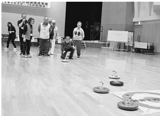
得点を競い盛り上がったイキイキスポーツ

午前中はイキイキスポーツが行われ、各老人クラブ対抗で軽スポーツやゲームで得点を競い合い、お互いに励まし合いながら運動を通して親睦を深めました。また、午後からは芸能発表会が行われ、サークル等練習を重ねてきた演芸を披露しました。