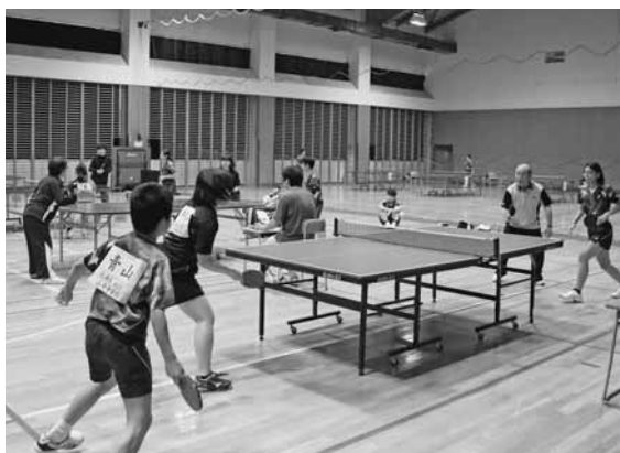
熱戦を繰り広げた町民卓球大会

大会には町内の小中学生から大人まで35名が参加し、男女別シングルス戦や中学生から大人の混合チームによる団体戦が行われ白熱した試合を展開していました。