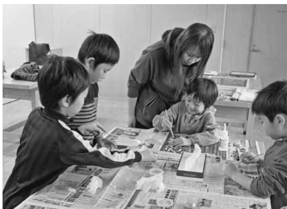
飾り付けに挑戦する子どもたち

七宝焼きは金属製の下地に様々な色の粒上のガラスを盛り、炉で焼くことで作られます。参加した子供たちは焼き上がり後の色合いを考えながら、思い思いの飾り付けを行いオリジナルのキーホルダーやブローチを作成しました。