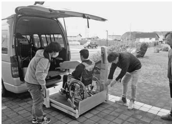
車いすの模擬入園者を移送する様子

園の職員は町の災害時の初動対応マニュアルに則り迅速に行動し、入園者の移送にかかる平均的な所要時間を計測し、有事の際の行動を確認しました。