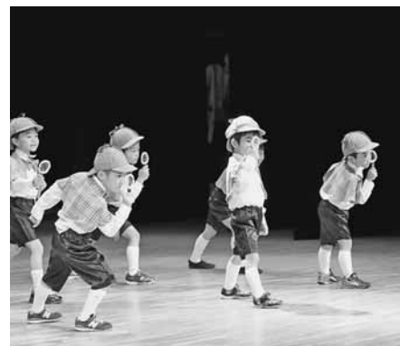
探偵になりきり、元気いっぱい踊った小平幼稚園のぎりん組