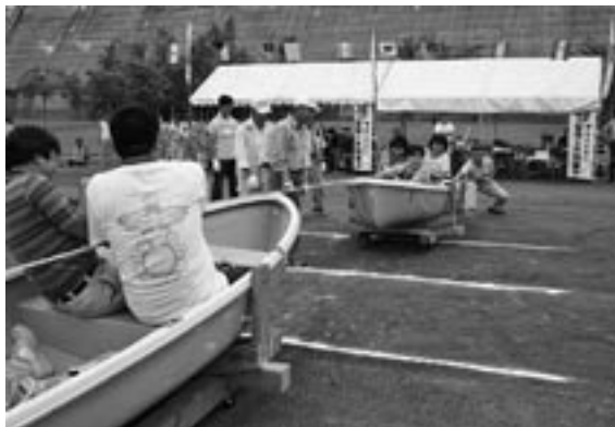
「陸上ボートレース」などのゲームで盛り上がった森と湖に親しむつどい

森と湖に親しむつどいが小平ダム公園で開かれ、訪れた地域住民ら約300人がゲームやイベントで楽しいひとときを過ごしました。 会場では、おびら太鼓麓龍と麓龍ジュニアによる力強い太鼓演奏やダム提体監査廊見学会、車輪つきのボートで綱引きをする「陸上ボートレース」など各種ゲーム大会が行われたほか、町内工事の受注業者が地域貢献としてゲームコーナーを出店し、来場者を楽しませました。 このほか、空知管内の沼田町と幌加内町の特産品やおびら手打ちそば愛好会の手打ちそばも販売され、人気を呼んでいました。