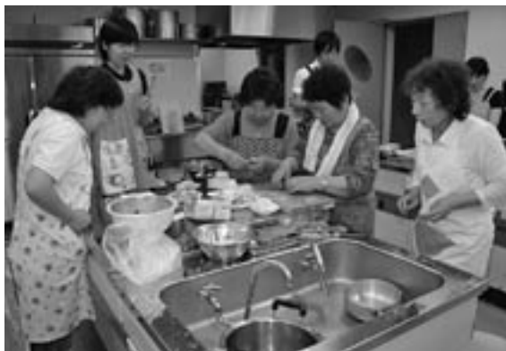
楽しみながら調理に取り組む参加者

町主催のコツコツ料理講習会が文化交流センターで開かれ、参加者15人がカルシウムたっぷりの料理づくりに挑戦しました。 はじめに、町栄養士が食材や調理手順について説明し、続いて行われた調理実習では、カルシウム豊富な食材を使った「厚揚げの豚肉包み焼き」、「切干大根のナムル」、「小松菜とチーズのわさび和え」の3品を調理し、全員で試食しました。 試食後には、町保健師による骨粗しょう症と骨折予防についての講話が行われ、参加者は真剣に話を聞いていました。