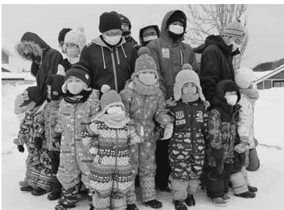
押しくらまんじゅうで体を温める園児たち