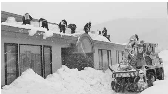
ヤマモト巧建株式会社（山本 博行代表取締役）様 小平幼稚園の周辺環境整備（2/11）