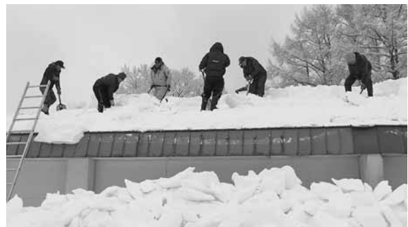
橋場・堀口経常建設共同企業体 様 旧寧楽小学校屋根の雪下ろし作業（2/8）