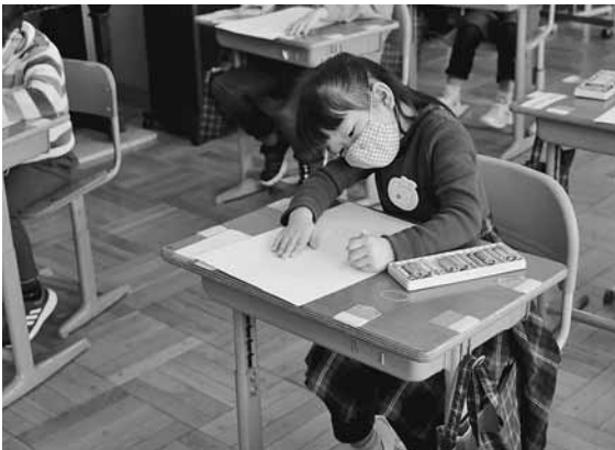
画用紙いっぱいに似顔絵を描く新入学児童(小平小)

鬼鹿小学校では、現一年生にアドバイスをもらいながらフリスビー作りに挑戦し、難しい作業は、サポートしてもらいながら丁寧に作り上げていました。