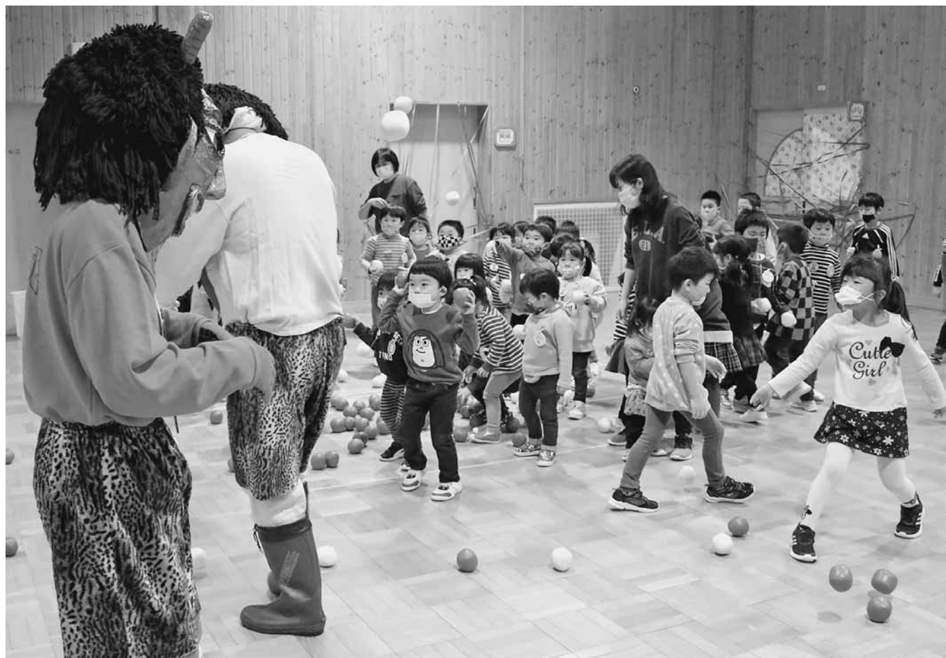
小平幼稚園豆まき会(2/2)