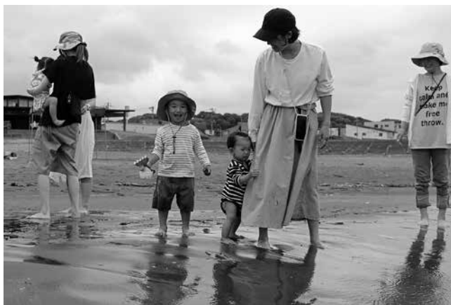
波打ち際で楽しむ子供たち

鬼鹿ツインビーチでは砂浜に隠されたお宝を探す宝探しや、テントにつるされた景品をジャンプして取る景品取りゲームなどで楽しむ子供たちの姿が見られました。