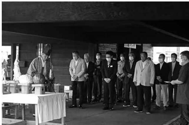
安全を祈願する関係者（鬼鹿ツインビーチ）

当日は、両海水浴場に家族連れの海水浴客が訪れ、遊泳や浜辺で遊んでいる姿が見られました。