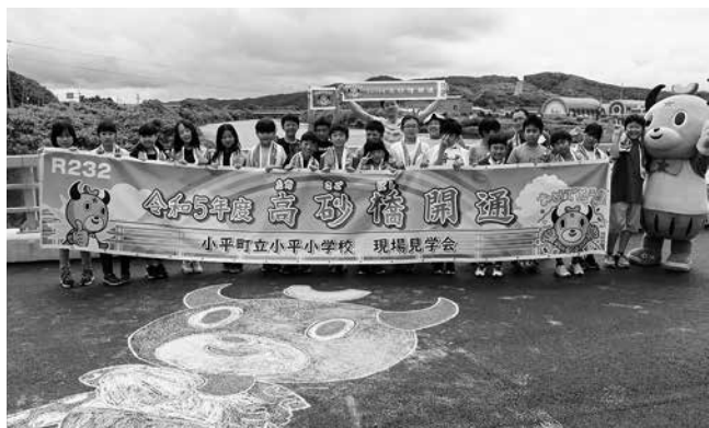
高砂橋で記念撮影

見学会では、4、5年生が工事現場で使用されているバックホウやコンパインドローラなどの重機を見学し、6年生については、昨年自分で書いた文字を使って作られた橋の名前や完成年を記した橋名板を建設職員らの指導を受けながら工具を使って取付けました。