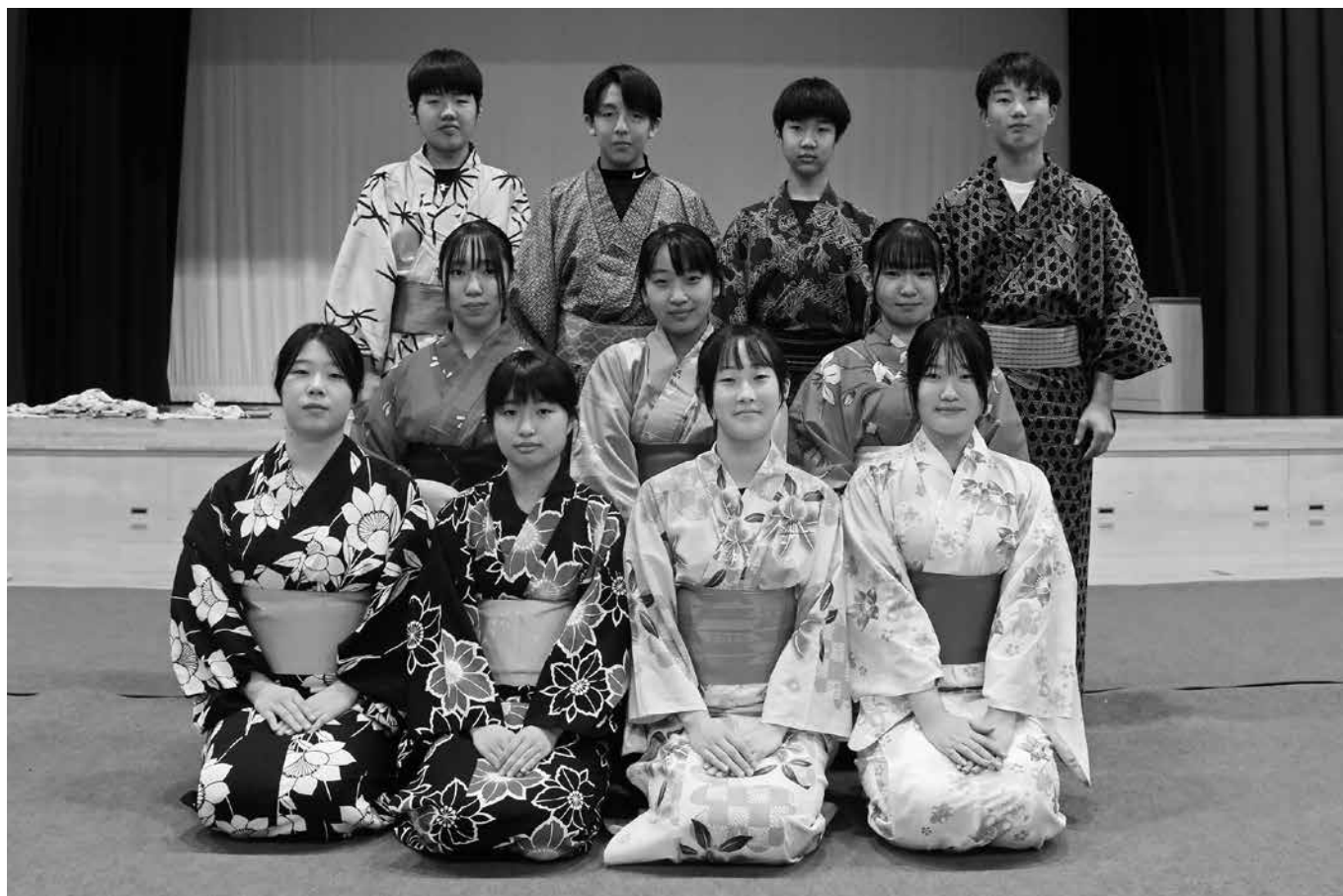
小平中学2年生 和装体験授業 (10/31)