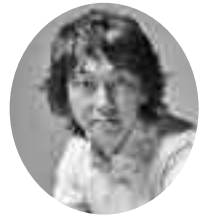
指揮者 橘 直貴